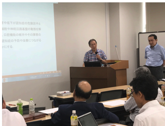
姜先生のご講演の様子