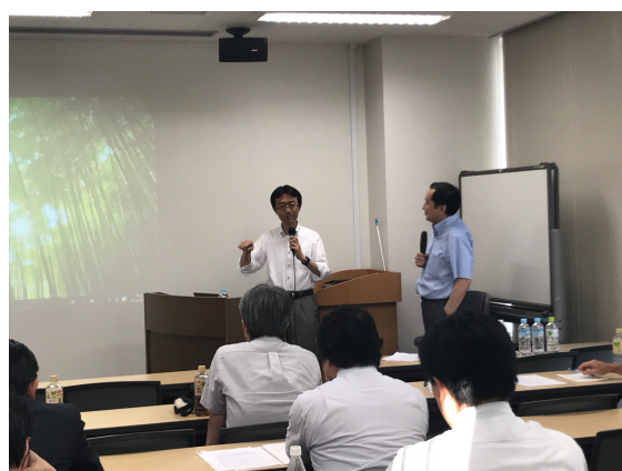
山本先生のご講演の様子